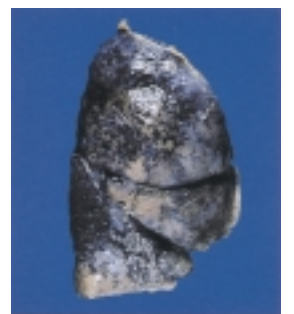
すべて真っ黒!!ヘビースモーカーの肺