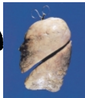
きれいな肉色の正常な肺