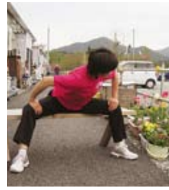
内ももと背中伸ばし