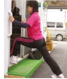
股関節とふくらはぎ