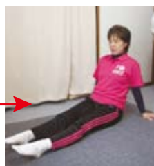
足首の曲げ伸ばし