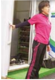
玄関の手すりを使って肩のストレッチ