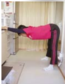
肩と太もも裏のばし