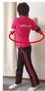
上体ひねり(左右・斜め上)