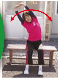
背伸び・体側伸ばし