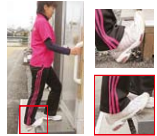
アキレス腱伸ばし