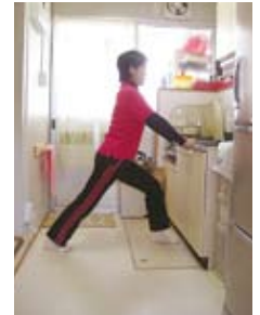
ふくらはぎ伸ばし